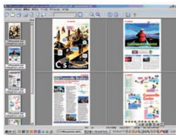
Miniatuurweergaven / Meerdere vensters